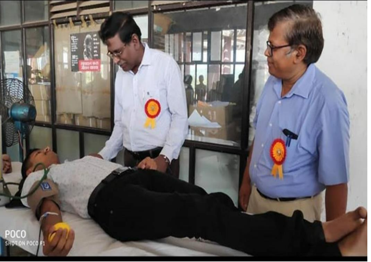
रक्तदान शिबीर (१६ ऑक्टोबर २०१९)