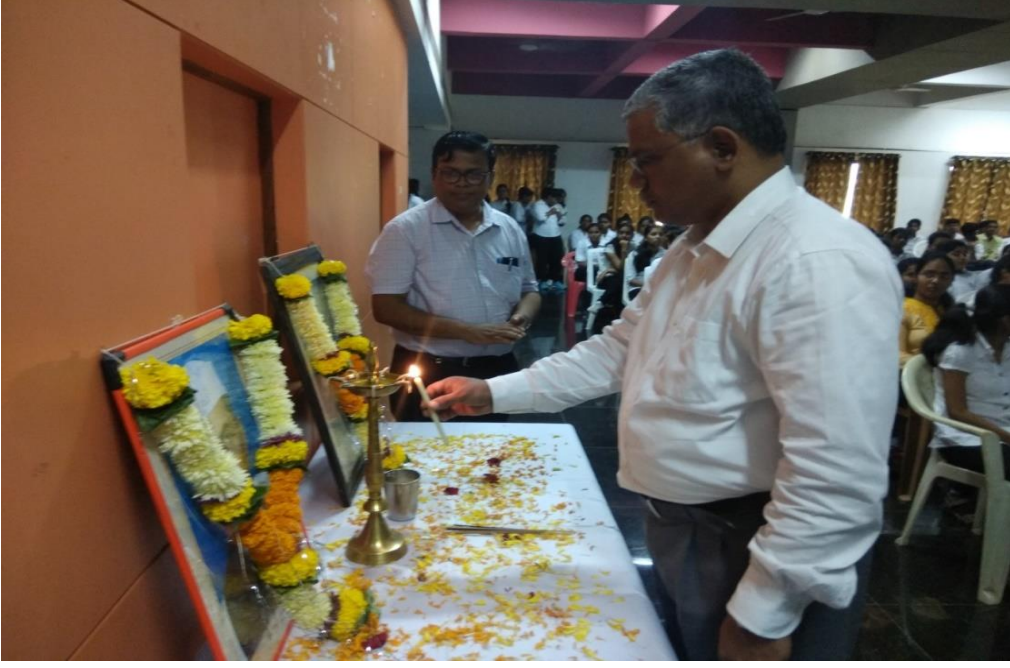
आंतरराष्ट्रीय शांतता व अहिंसा दिवस