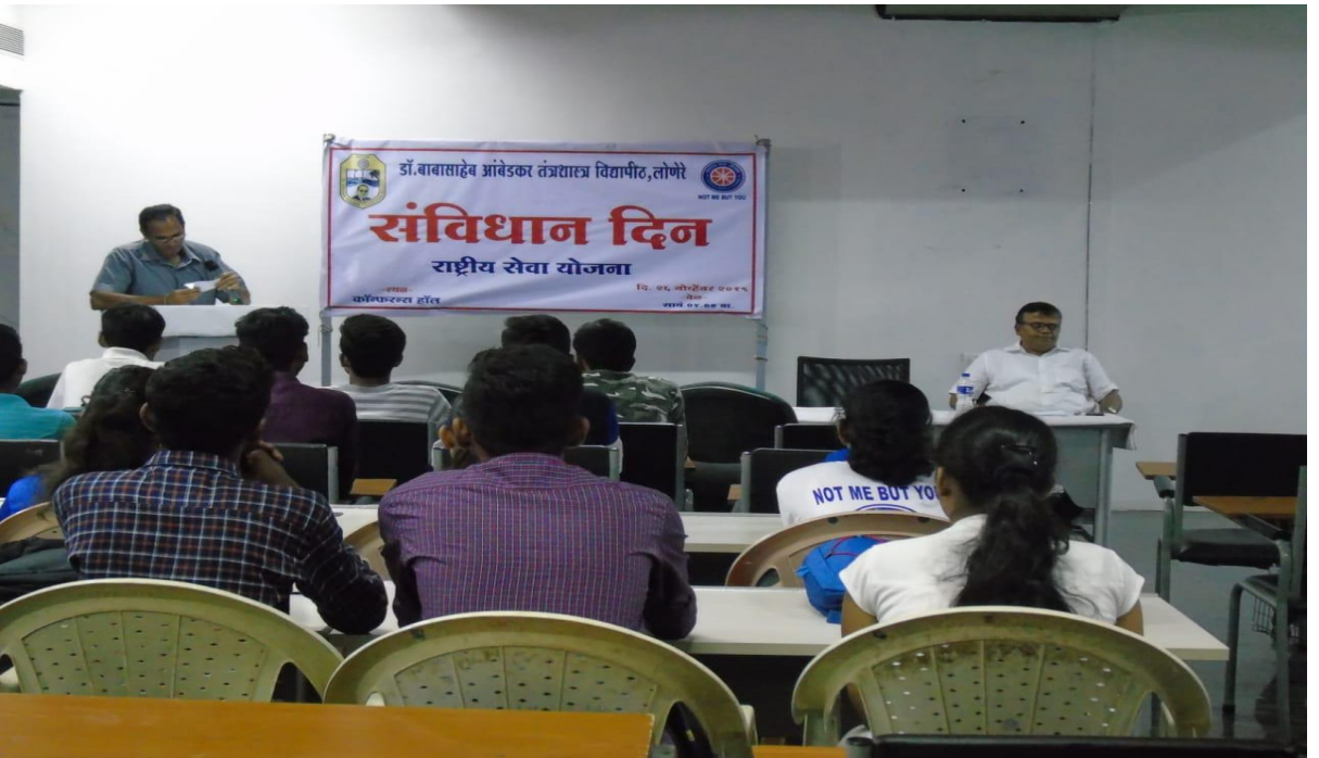
संविधान दिन (२६ नोव्हेंबर २०१९)