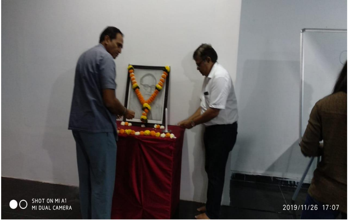
संविधान दिन (२६ नोव्हेंबर २०१९)