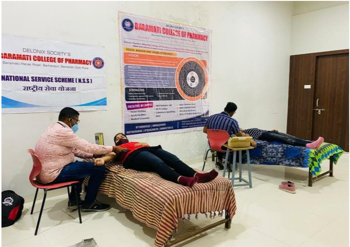
डेलोनक्स सोसायटी बारामती कॉलेज ऑफ फार्मसी, पुणे (रक्तदान शिबिर, ८ मार्च २०२२)