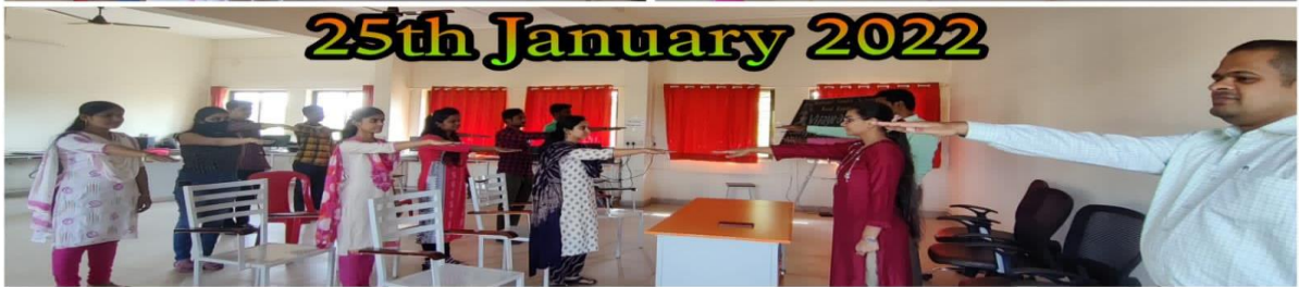
विजयराव नाईक कॉलेज ऑफ फार्मसी, सिंधुदुर्ग (राष्ट्रीय मतदार दिवस, २५ जानेवारी २०२२)