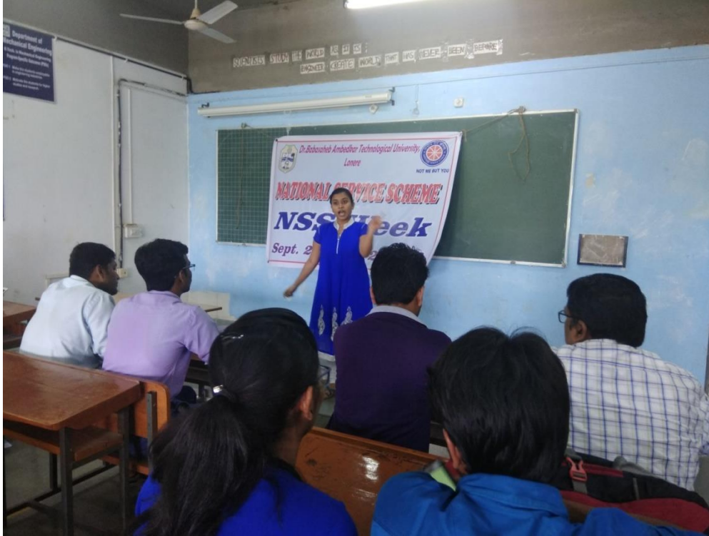
भाषण स्पर्धा : राष्ट्रीय सेवा योजना सप्ताह