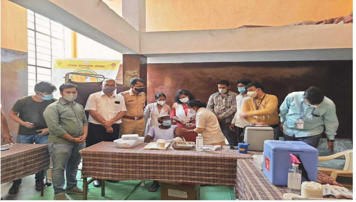
नानासाहेब महाडिक कॉलेज ऑफ इंजिनिअरिंग, सांगली (कोरोना लसीकरण, १६ जानेवारी २०२२)