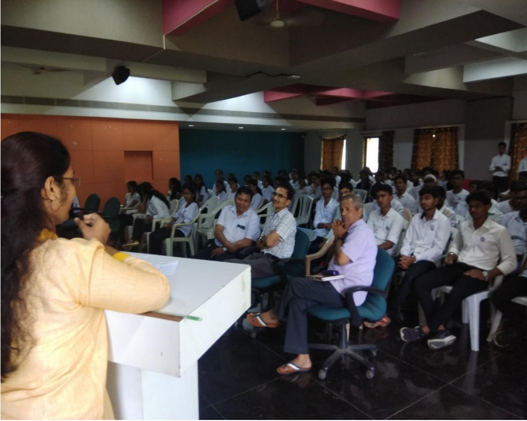
आंतरराष्ट्रीय शांतता व आहिंसा दिवस : विद्यार्थी सहभाग