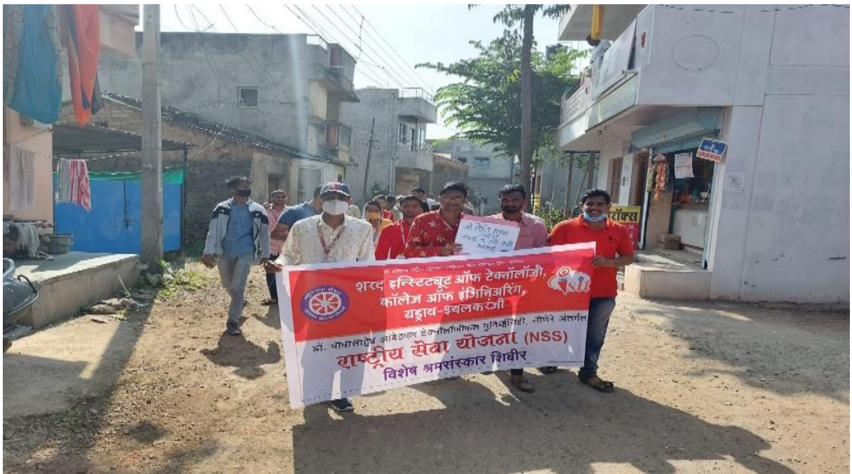
शरद इन्स्टिट्यूट ऑफ टेक्नॉलॉजी, कॉलेज ऑफ इंजिनियरिंग, कोल्हापुर (श्रमसंस्कार शिविर)