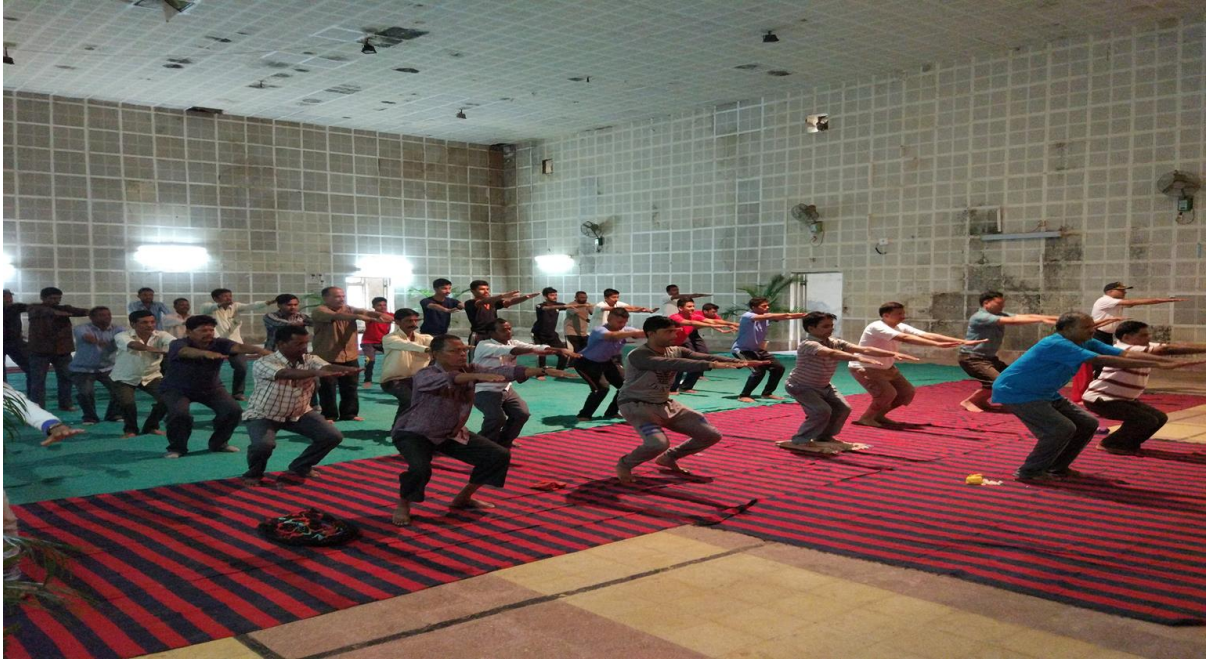
जगतिक योगा दिवस ( जून २१, २०१७)