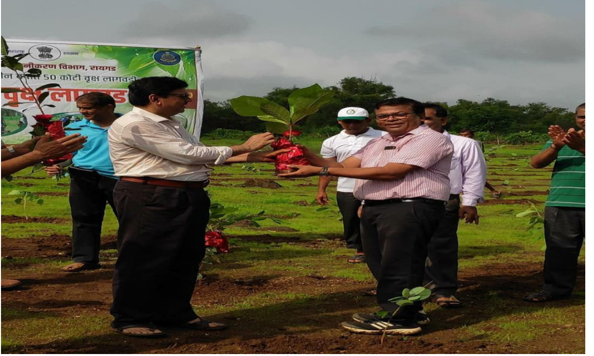
वृक्षारोपण (जुलै १, २०१९)