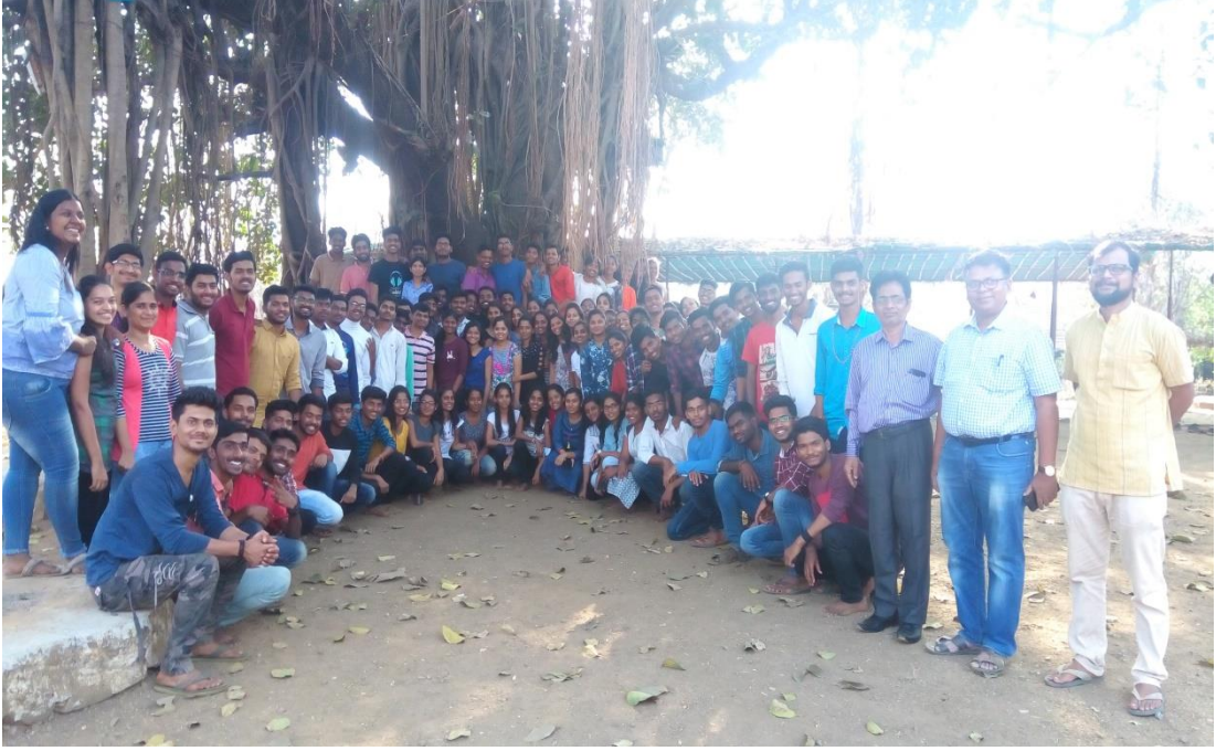
राष्ट्रीय सेवा योजना वार्षिक शिबिर (१८ मार्च ते २४ मार्च २०१९)