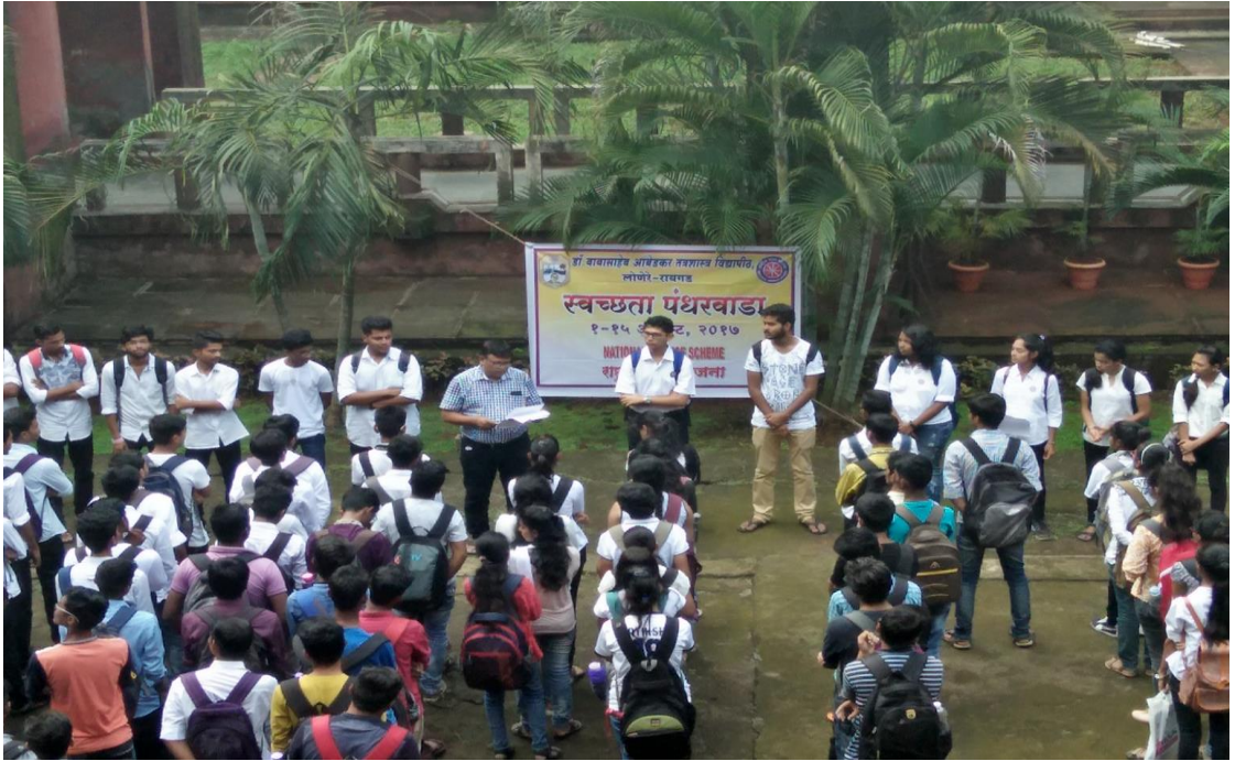
स्वच्छता पंधरवाडा (ऑगस्ट १ ते १५, २०१७)