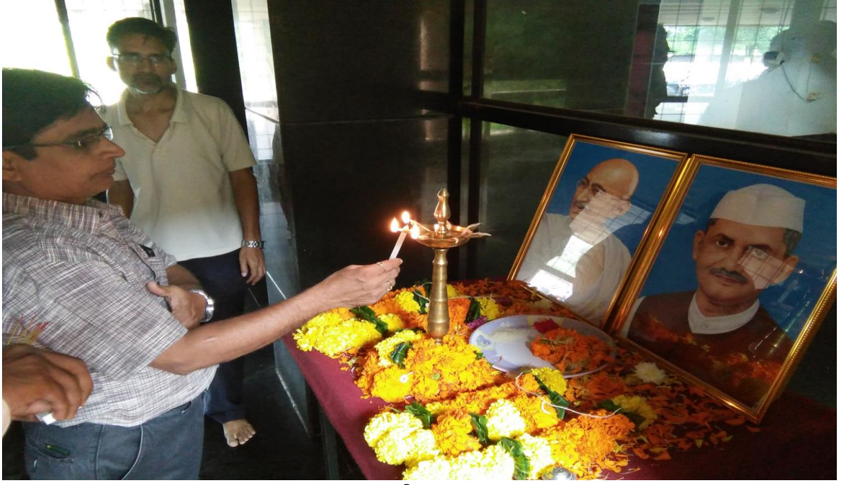
गांधी जयंती (ऑक्टोबर २, २०१७)