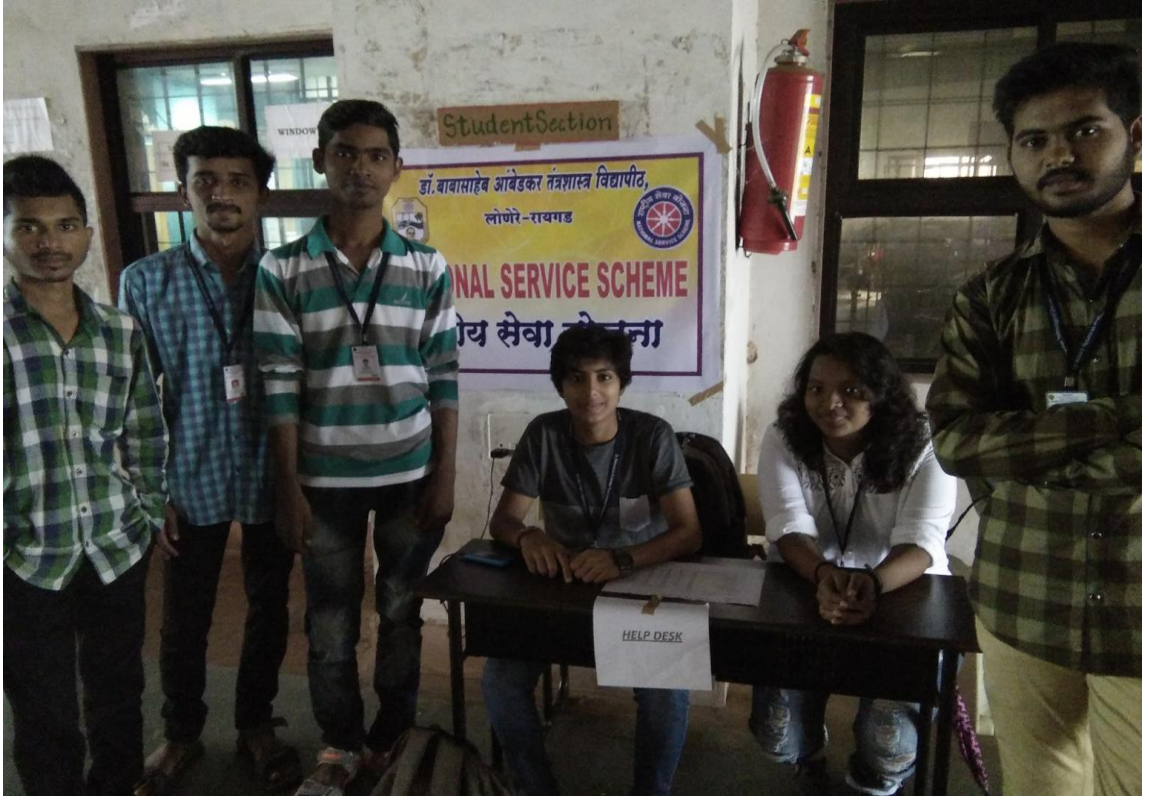
हेल्पडेस्क ( जूलै २४ ते २८, २०१७)