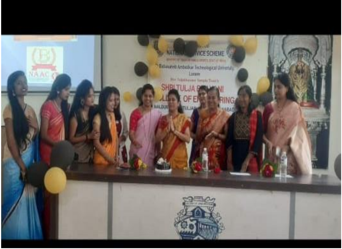
श्री. तुळजाभवानी कॉलेज ऑफ इंजिनिअरिंग, तुळजापुर ( महिला दिन,११ मार्च २०२२)