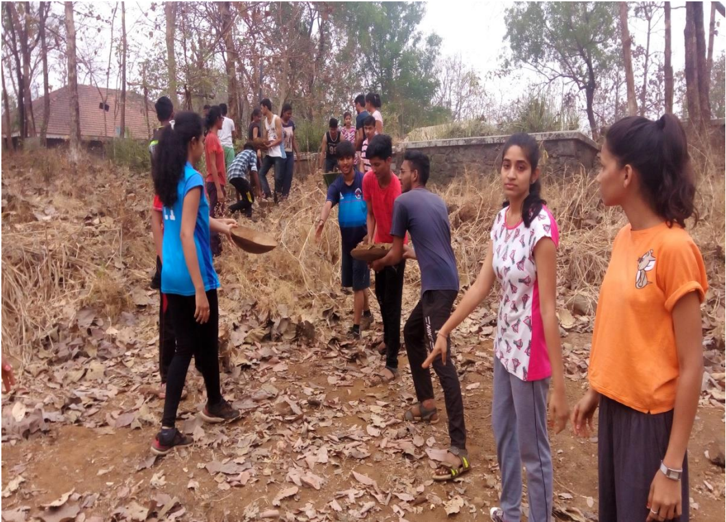
रासेयो च्या वार्षिक शिबिरात विद्यार्थ्यांचे श्रमदान