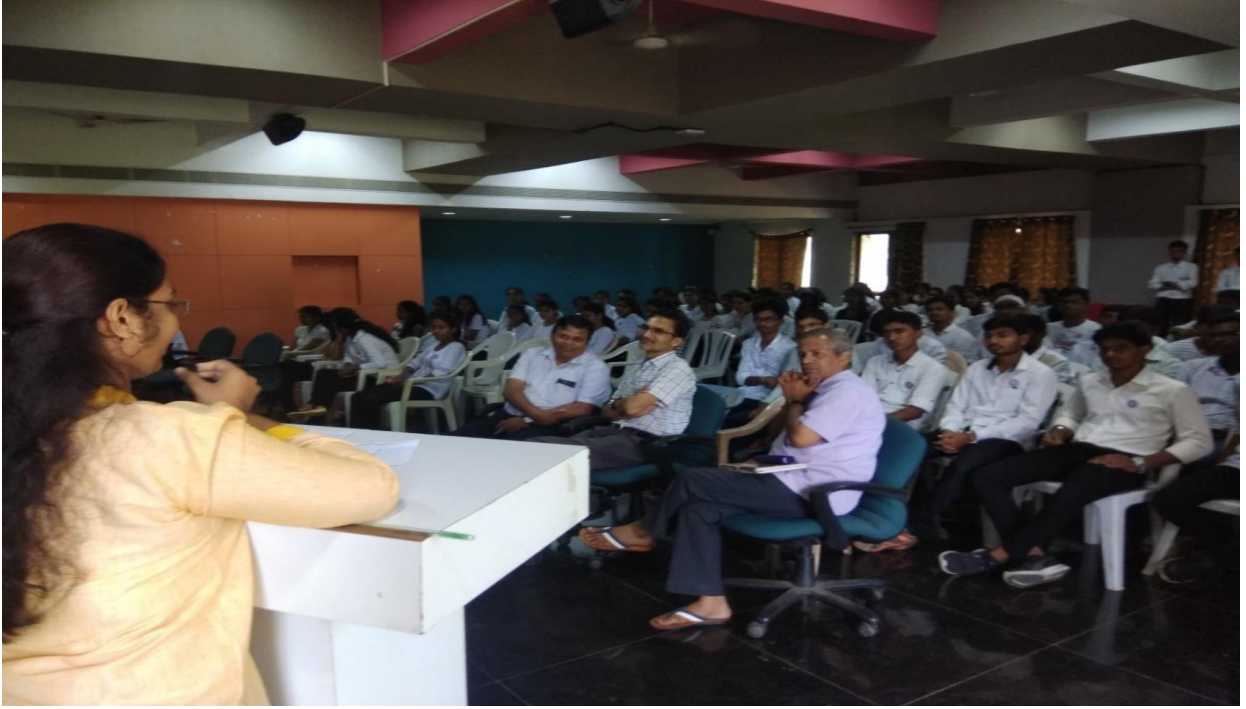
Constitution Day (26 November 2019)