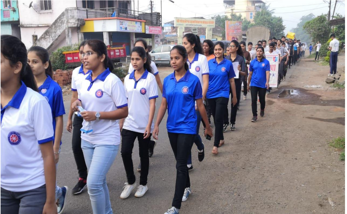
महार्वाकाथॉन रॅली (३० नोव्हेंबर २०१९)