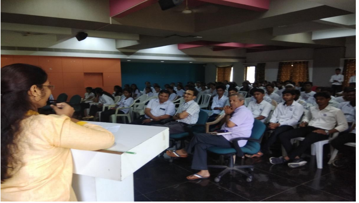
Constitution Day (26 November 2019)