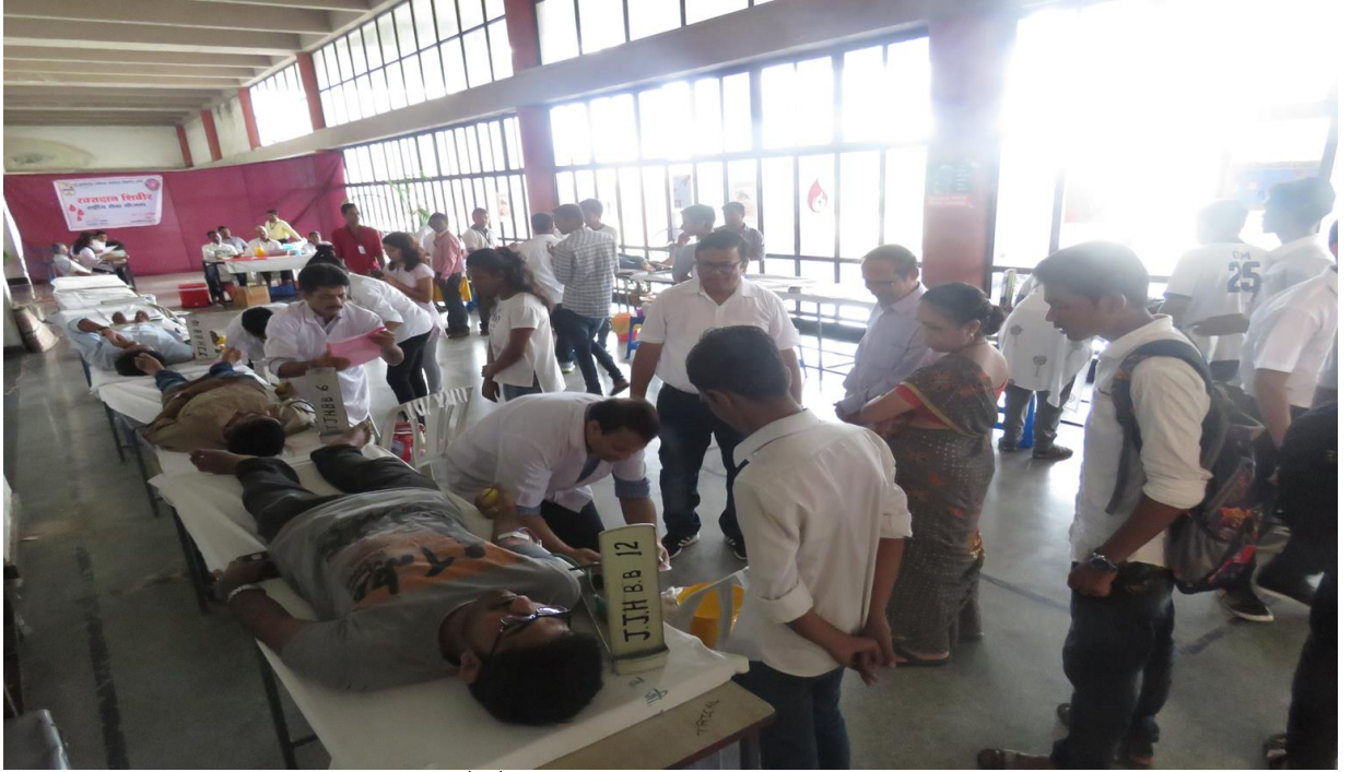
रक्तदान शिबिर व थॅलेसेमिया चाचणी (सप्टेंबर १८, २०१७)