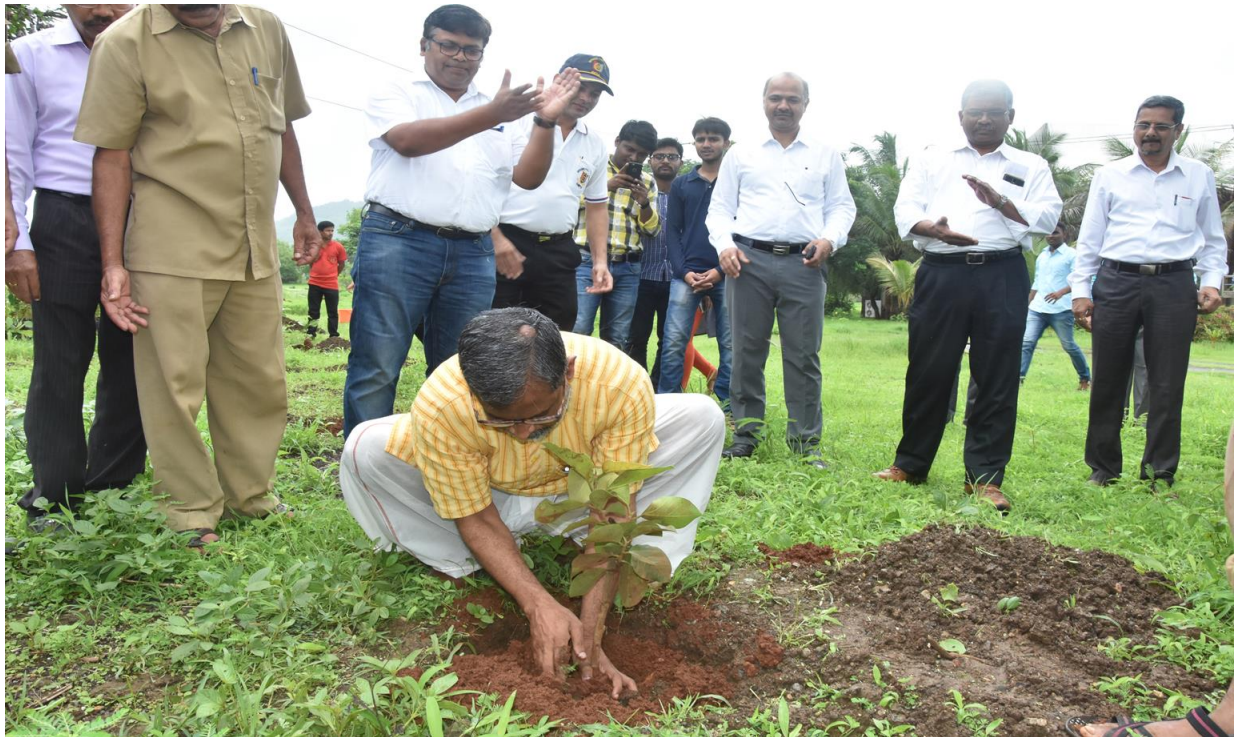
वृक्षारोपण ( जूलै १, २०१७)