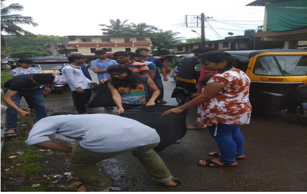
स्वच्छता अभियानांतर्गत लोणेरे गावातील बसस्थानक स्वच्छता