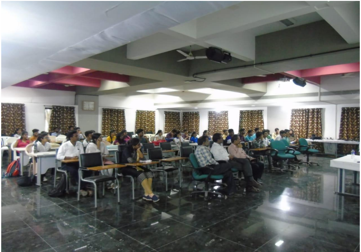
संविधान दिन (२६ नोव्हेंबर २०१९)