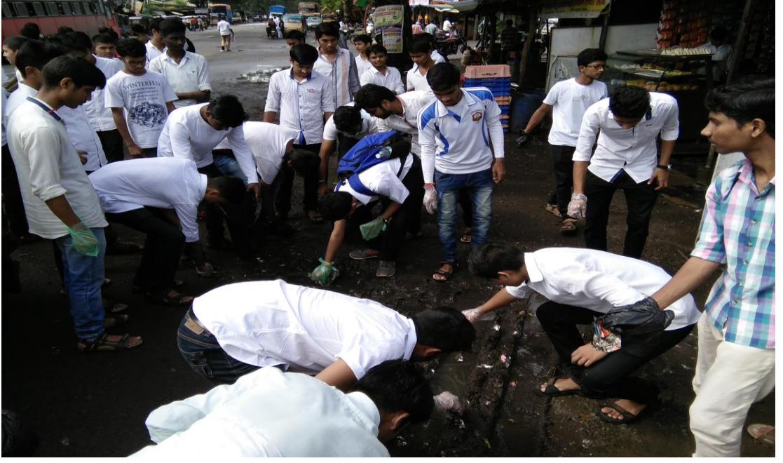
स्वच्छता पंघरवाडा (ऑगस्ट १ ते १५, २०१७)