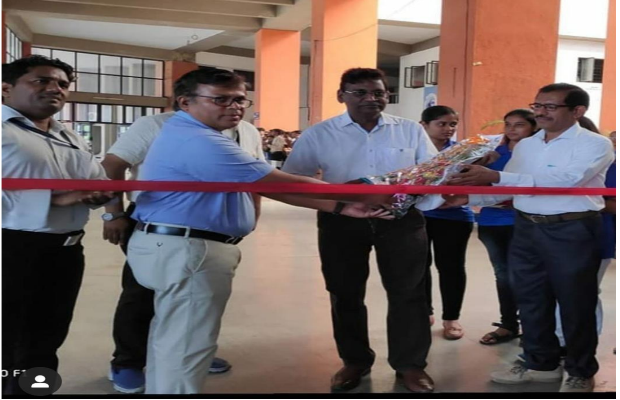
Constitution Day (26 November 2019)