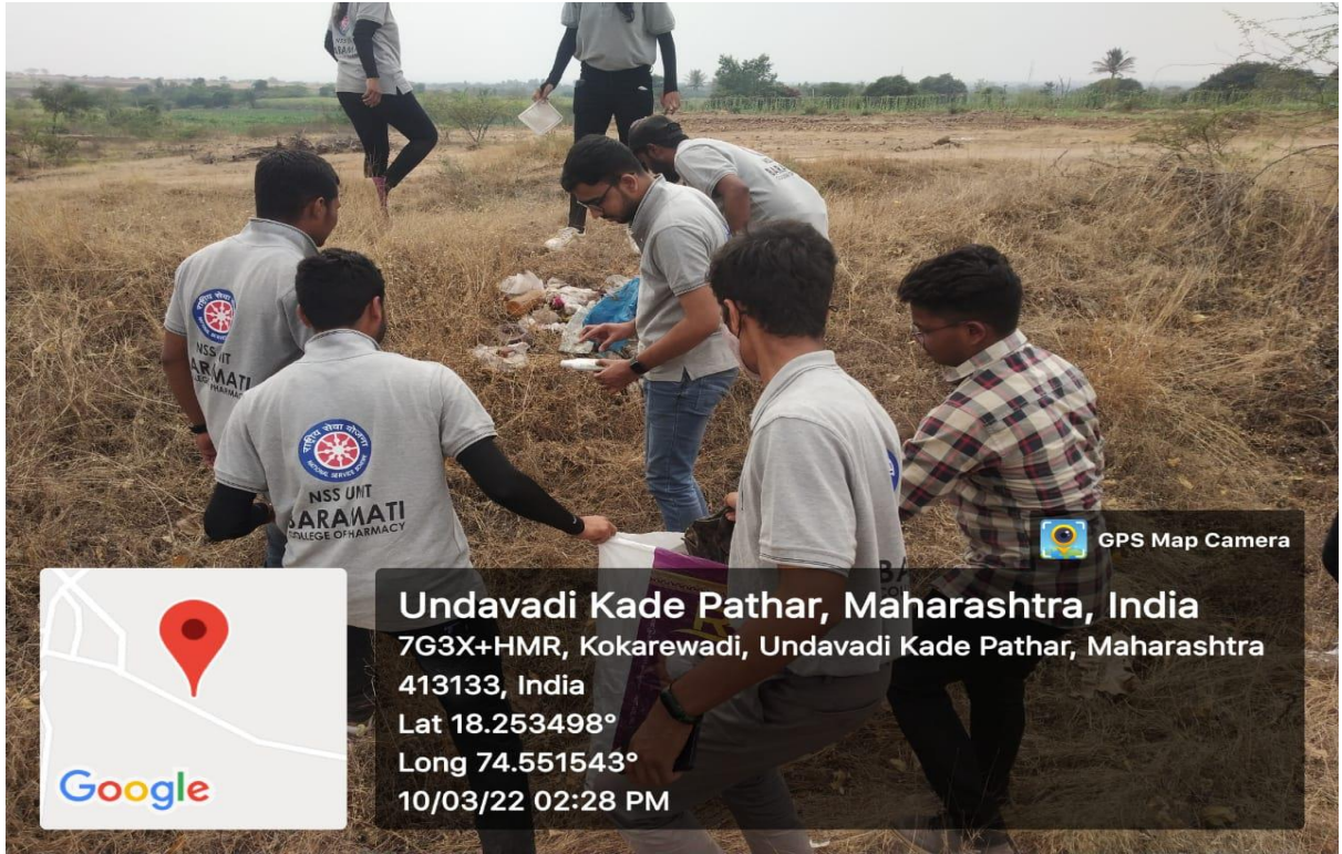
डेलोनक्स सोसायटी बारामती कॉलेज ऑफ फार्मसी, पुणे (स्वच्छता अभियान, १० मार्च २०२२)