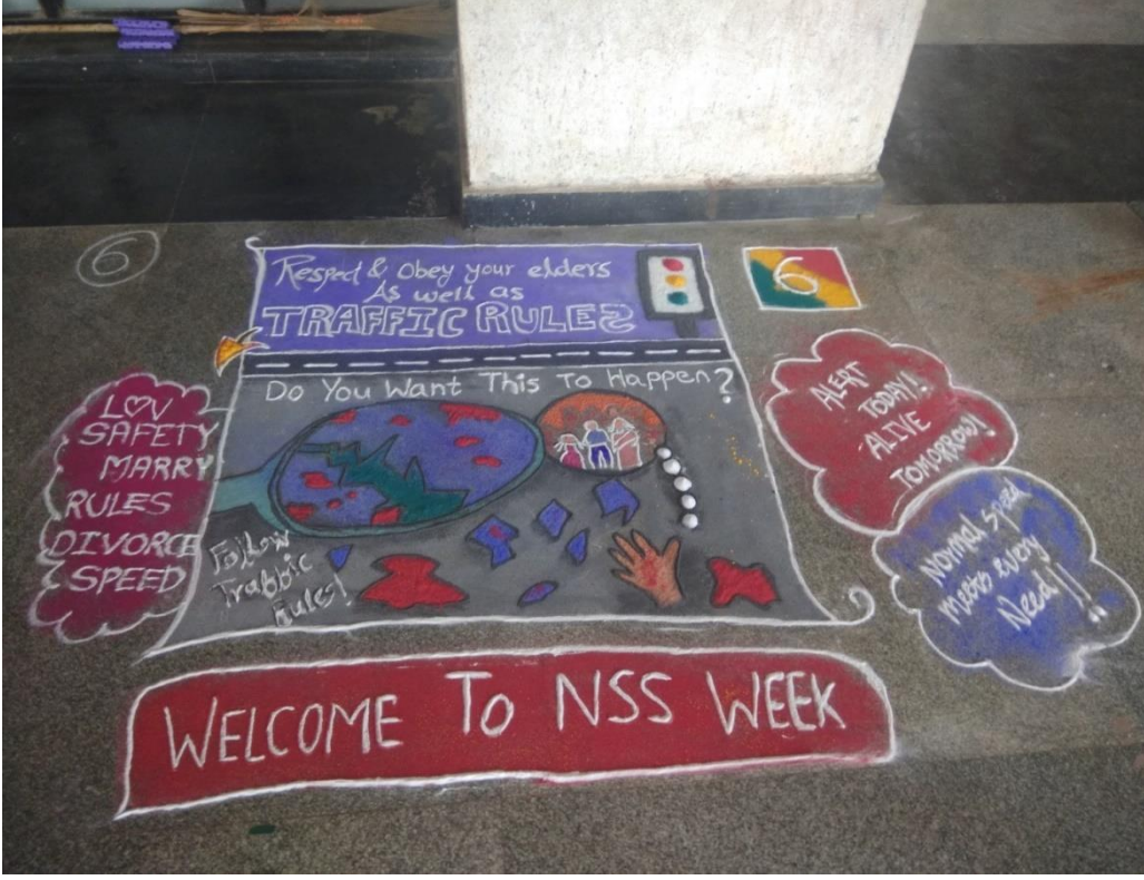
रांगोळी स्पर्धा : राष्ट्रीय सेवा योजना सप्ताह