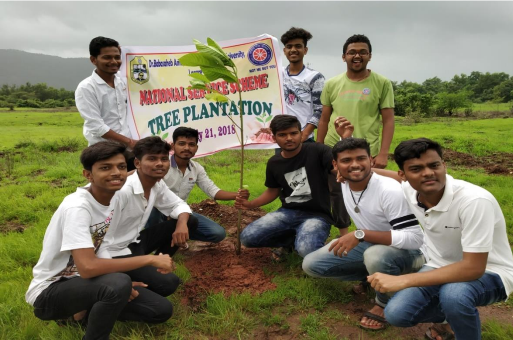
विद्यार्थांचा वृक्षारोपणात सहभाग