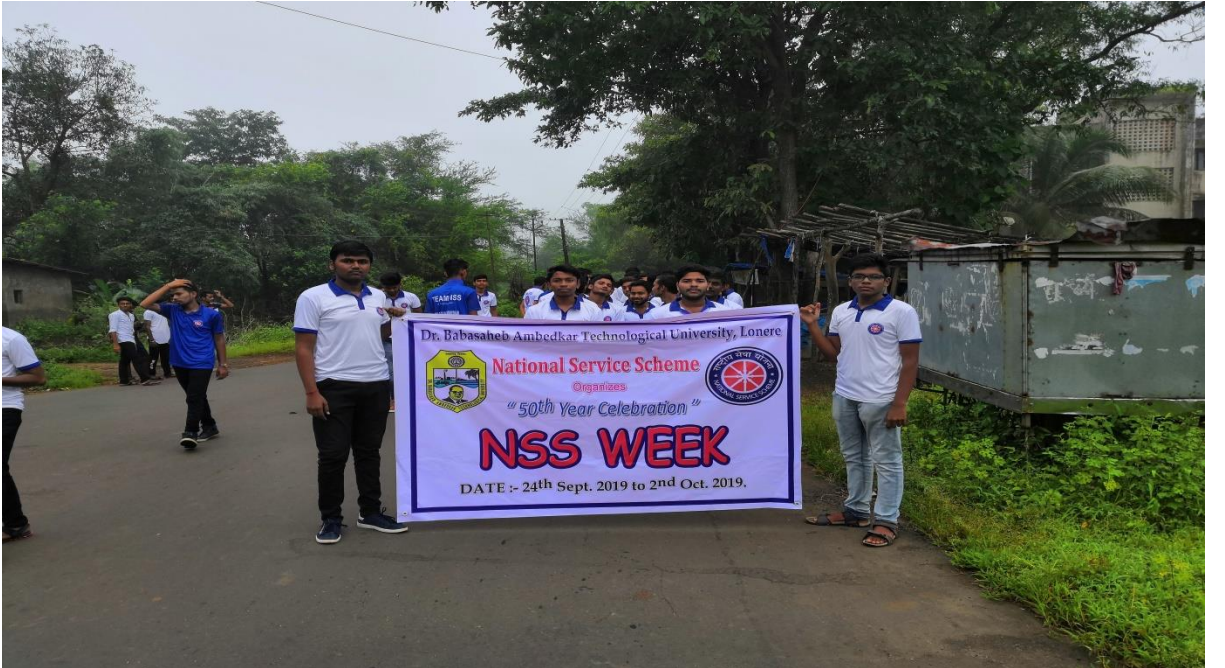
राष्ट्रीय सेवा योजना सप्ताह (२४ सप्टेंबर ते २ ऑक्टोबर २०१९)