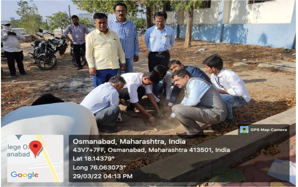
कॉलेज ऑफ इंजिनियरिंग, उस्मानाबाद (वृक्षरोपण, २९ मार्च २०२२)