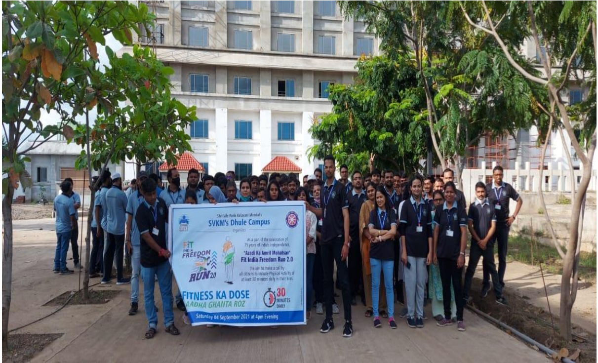
एस. व्ही. के. एम. एस. महाविद्यालय, धुळे (आझादी का अमृत महोत्सव, ४ सप्टेंबर २०२१)