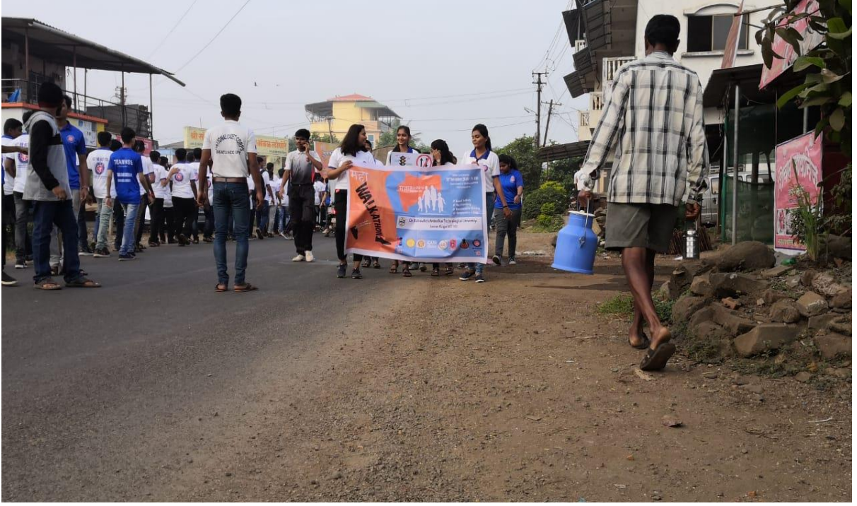
महार्वाकाथॉन (३० नोव्हेंबर २०१९)