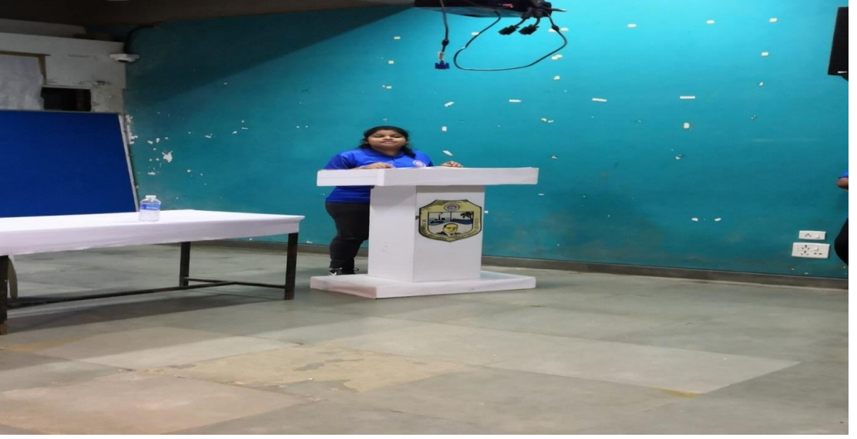
भाषण स्पर्धा ( राष्ट्रीय सेवा योजना सप्ताह)