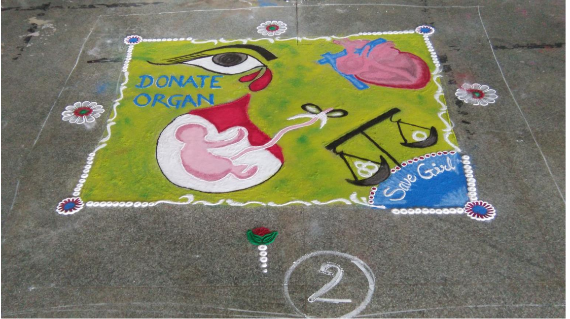
राष्ट्रीय सेवा योजना सप्ताह (सप्टेंबर २४ ते ऑक्टोबर २, २०१७)