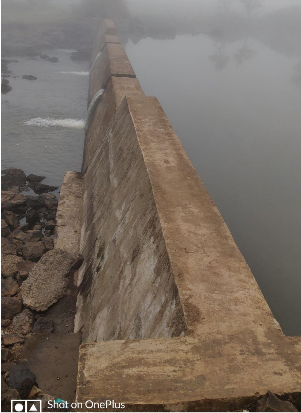
Photo 1, 2: Concrete Barrage No. 2 in Project. Photo taken on 18/11/19. This water remains as seen till end of March. Thereafter reservoir level remains 0.7 to 1.0 m till onset of monsoon.