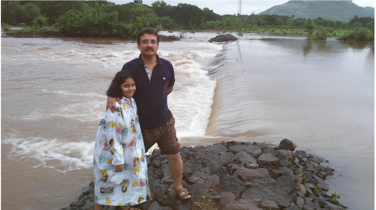
Photo 3: Concrete Barrage No.2. Overflowing in every July till end of August.