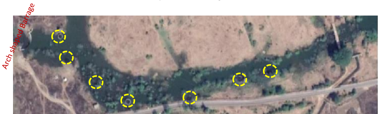
Photo 11: Water supply scheme intake wells along upstream of 1 st barrage. These have been constructed by local village panchayats at their costs after completion of this Project.