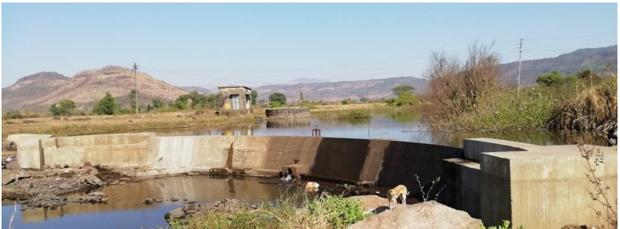
Photo 4↑, 5↓: Concrete Barrage No.1 in arch shape to take advantage of V shaped rocky gorge